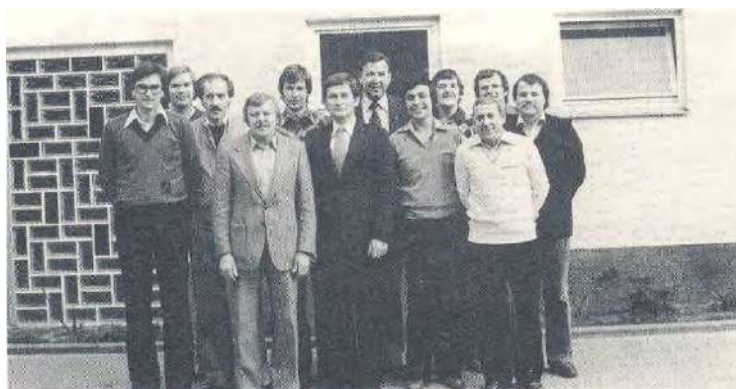
Der Vorstand im Jubiläumsjahr 1979