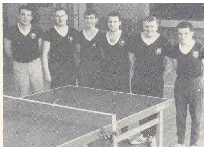
Aufsteiger in die Landesliga 1966/67