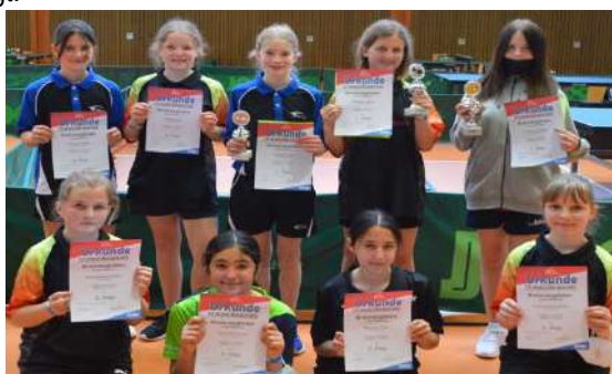
Siegerehrung der Mädchen 13