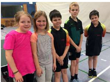
Teilnehmer der Bezirksvorrangliste 2019 C Schüler/-innen

Alle 5 Nachwüchslers wurden neue Vereinsmitglieder und nahmen gleich an der Spielsaison 2019/2020 teil.