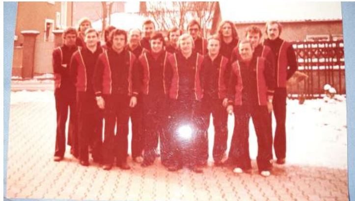
Gruppenbild Der aktive Herren