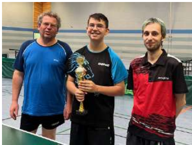
Vereinsmeister 2023 größer 1500 TTR.