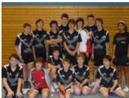
der Nachwuchsbereich 2010

Im Jahr 2010 nahmen erstmalig eine TSK - Jugendgruppe an einem Tischtennislehrgang in Grensau teil.