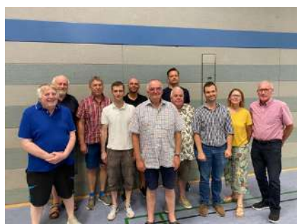
auf dem Bild fehlt Birgit Kilian