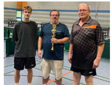
Vereinsmeister 2023 kleiner 1200 TTR