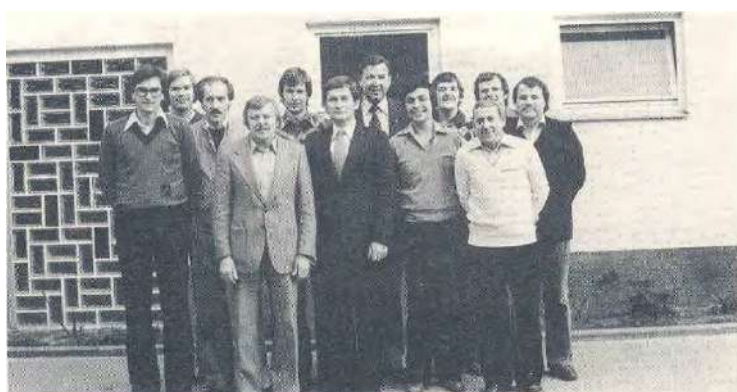
Der Vorstand im Jubiläumsjahr 1979