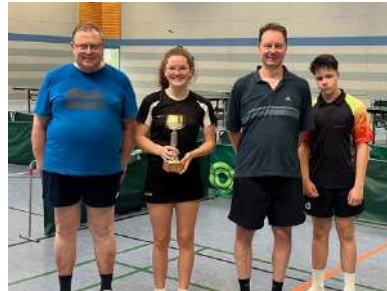
Vereinsmeister 2023 1200 -1500 TTR