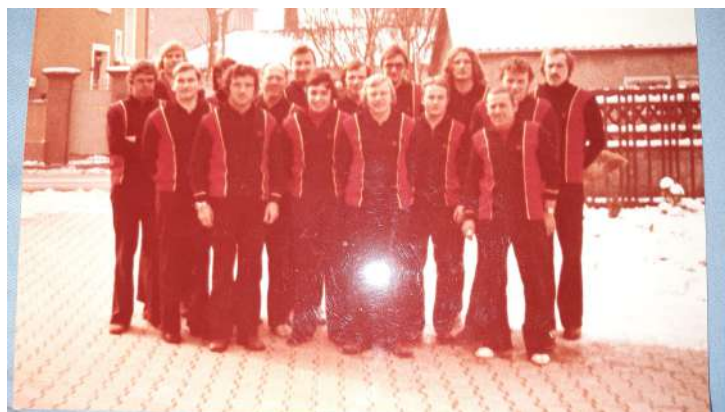
Gruppenbild Der aktive Herren