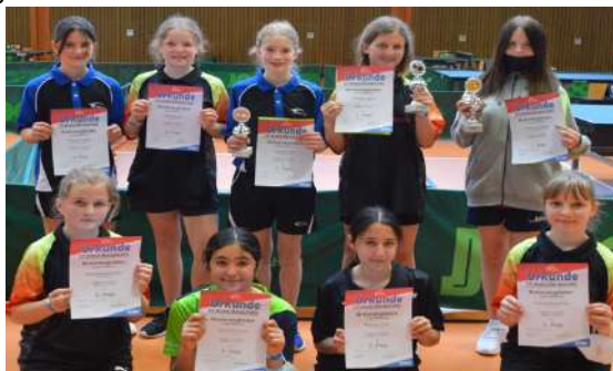
Siegerehrung der Mädchen 13